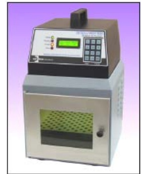
安装在 RAYVEN 固化箱上的 INTELLIRAY

INTELLIRAY 是一款紧凑型智慧控制大面积紫外固化设备。不像其它竞争系统，INTELLIRAY集成所有系统组件到一个很小的光源中，非常容易安装在工厂的任何地方，不需要任何独立电源或是控制盒。只要连接普通电源线，就可以开始定时的紫外固化啦！设备带有液晶显示和数字键盘，轻松实现编程和监控固化操作。可以选配RAYVEN全防护固化箱，组成功能强大的全防护UV固化箱。也可以选择滑行调节高度的支架和UV防护罩，组成简单的UV固化箱。